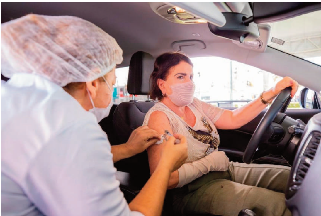
Percentual de vacinados, até esta quarta-feira, é de 7,49% da Capital

Nesta quinta-feira, a vacinação segue com os idosos com 68 ou mais. A imunização dos trabalhadores da saúde a partir dos 50 anos também continua na capital. Além dos dois drives-thrus do Estacionamento do Jaraguá e da Justiça Federal (Serraria), a Prefeitura trabalha com os seguintes pontos fixos de vacinação: Ginásio Arivaldo Maia (Jacintinho), Maceió Shopping (Mangabeiras), Pátio Shopping (Cidade Universitária) e Papódromo (Vergel do Lago), e nas praças do Osman Loureiro e Padre Cícero, no Benedito Bentes.